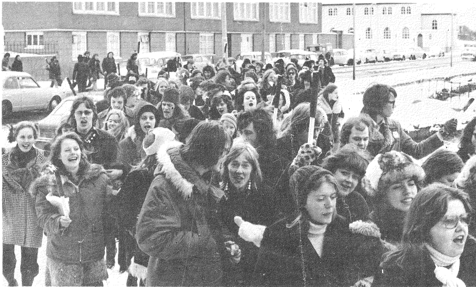
Föngulegur hópur stúdentsefna frá MT leggur af stað í blysför kringum tjörnina. Þessi ganga var hluti af þeirri athöfn, þegar verðandi stúdentar kvöddu skóla sinn.